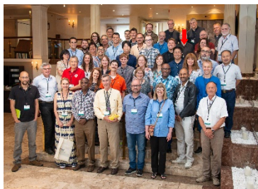
全體與會學者合照